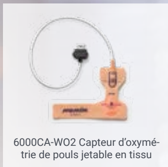
6000CA-WO2 Capteur d'oxymétrie de pouls jetable en tissu