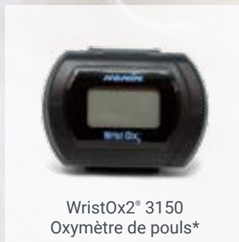
WristOx2® 3150 Oxymètre de pouls*