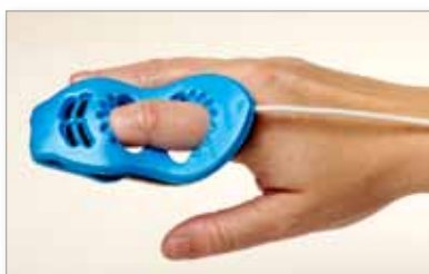
6500SA Einwegsensoren aus Durafoam - Standard Erwachsene/Kinder