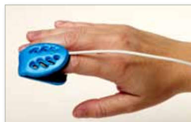
6500MA Einwegsensoren aus Durafoam - Klein Erwachsene/Kinder

Packungsgröße: 5 Sensoren pro Packung. Nur mit Pulsoximetrieprodukten von Nonin verwenden.