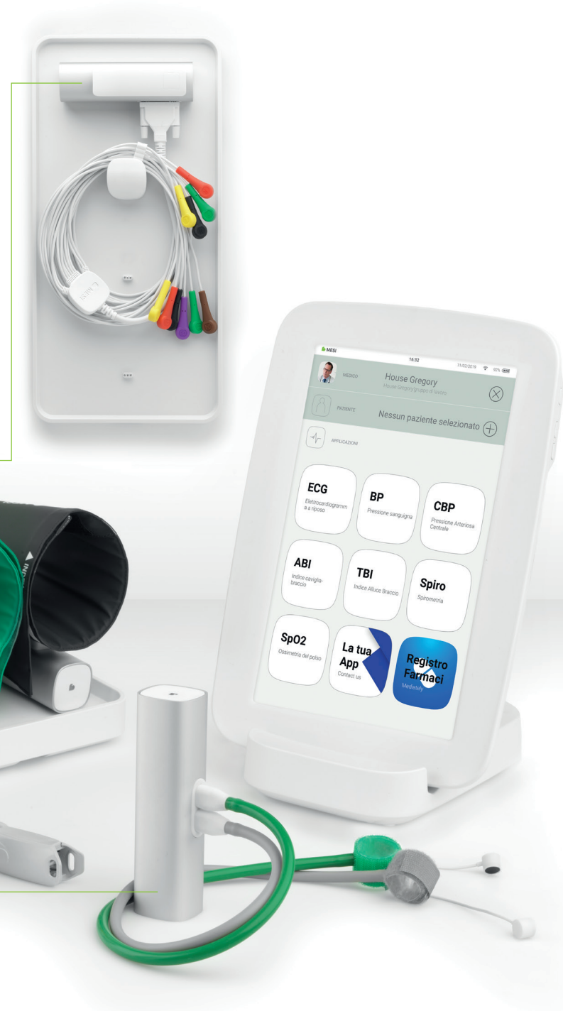
ECG a 12 derivazioni

Le prestazioni e funzionalità possono essere incrementate con numerosi software e strumenti diagnostici disponibili sul mercato – mSTORE .